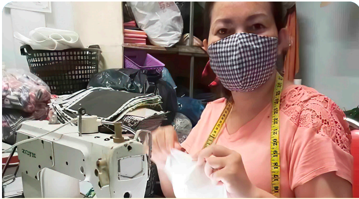
Una trabajadora en domicilio cambojana confecciona mascarillas.

El gobierno acordó realizar un proyecto piloto con los conductores de tuk-tuk y las trabajadoras del hogar. Ya que aceptó, indica Sinoeun, que estas personas trabajadoras “no van a efectuar el mismo aporte [que quienes trabajan en el sector formal] porque sus ingresos son más bajos e inestables”. Además, el NSSF, la IDEA (Asociación para la Democracia Independiente de la Economía Informal), WIEGO y HNC han acordado implementar un proyecto piloto similar con las personas vendedoras ambulantes y trabajadoras en domicilio. WIEGO actualmente está calculando el costo de este proyecto piloto.