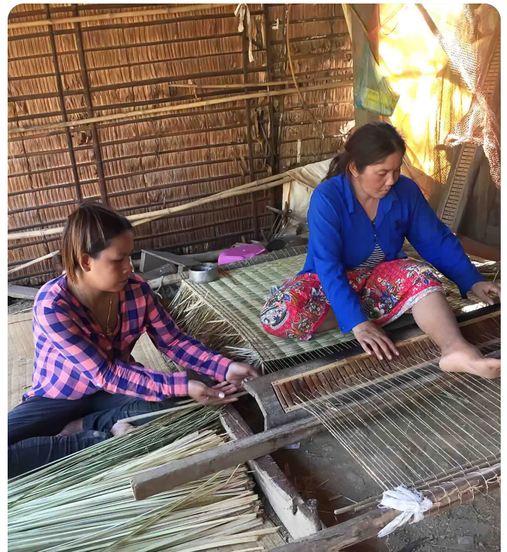
Personas trabajadoras en domicilio elaboran esteras de caña.

Esta acción les permitió a las mujeres dedicar más tiempo a fabricar las esteras y aumentar sus ingresos. Todo el apoyo que se brindaba a los grupos de trabajadoras en domicilio debía realizarse de tal forma que les permitiera “ser sostenibles” e independientes.