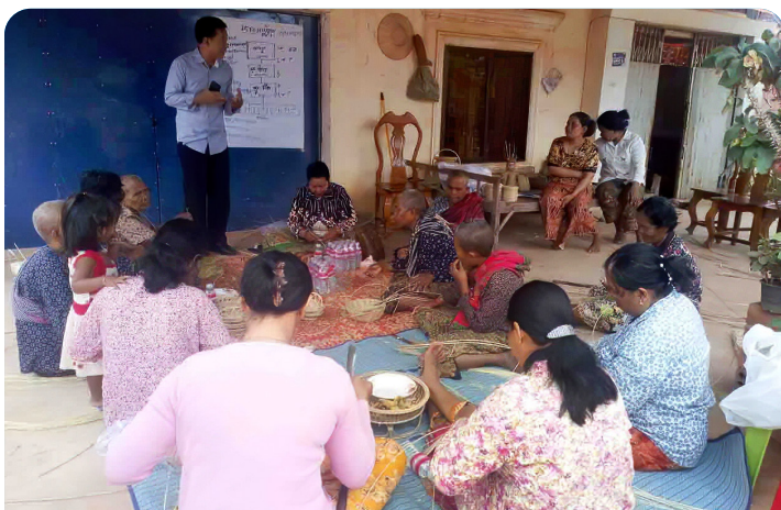
Un pequeño grupo de personas trabajadoras en domicilio realizan una capacitación sobre técnicas organizativas.