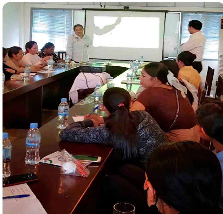
Personas trabajadoras en domicilio realizan una capacitación sobre la protección social.

HNC, con la ayuda de la organización internacional Mujeres en Empleo Informal: Globalizando y Organizando (WIEGO), entrevistó a 311 de las personas trabajadoras en domicilio que la integran en Siem Reap, Battambang y Phnom Penh. Querían averiguar cuántas